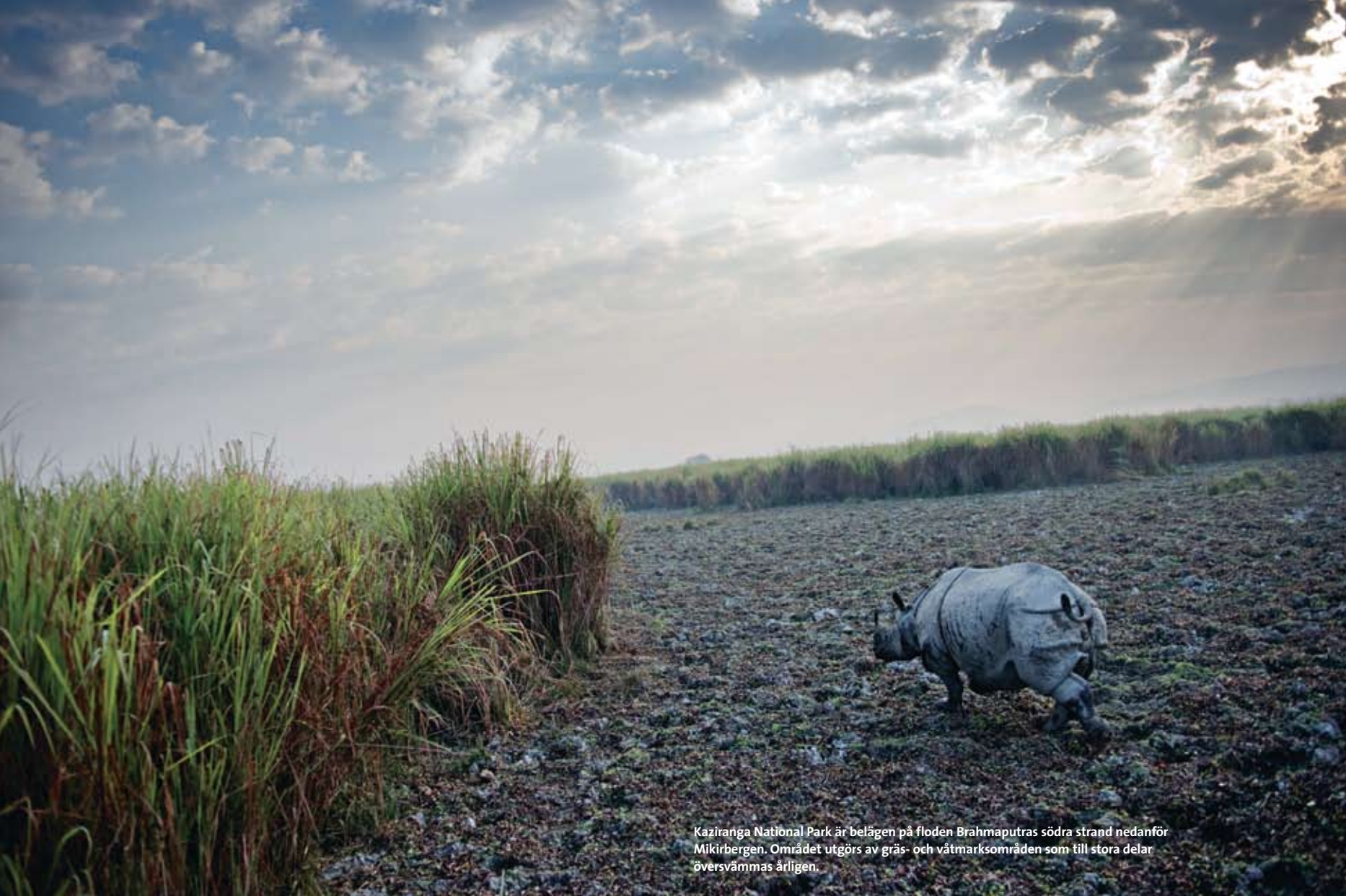
Kaziranga National Park är belägen på floden Brahmaputras södra strand nedanför Mikirbergen. Området utgörs av gräs- och våtmarksområden som till stora delar översvämmas årligen.