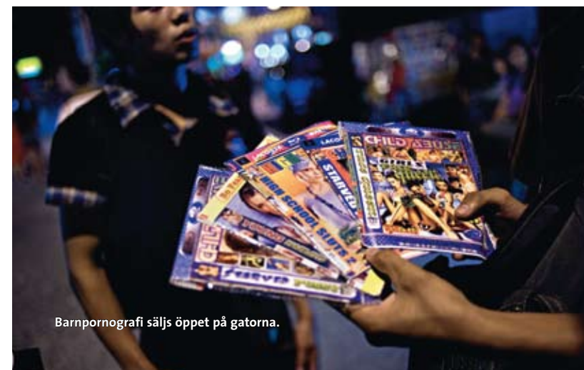
Barnpornografi säljs öppet på gatorna.