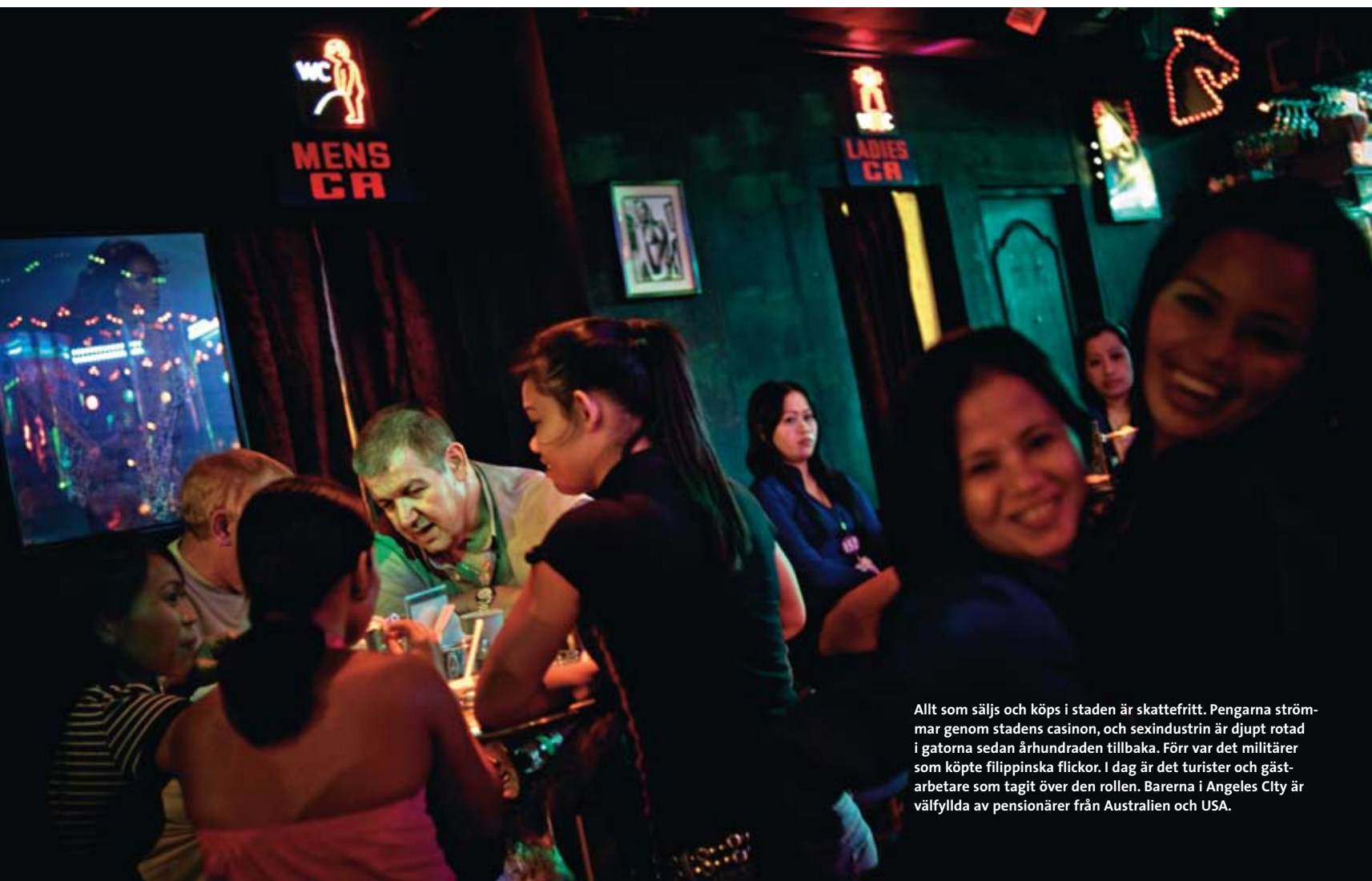
Allt som säljs och köps i staden är skattefritt. Pengarna strömmar genom stadens casinon, och sexindustrin är djupt rotad i gatorna sedan århundraden tillbaka. Förr var det militärer som köpte filippinska flickor. I dag är det turister och gästarbetare som tagit över den rollen. Barerna i Angeles City är välfyllda av pensionärer från Australien och USA.