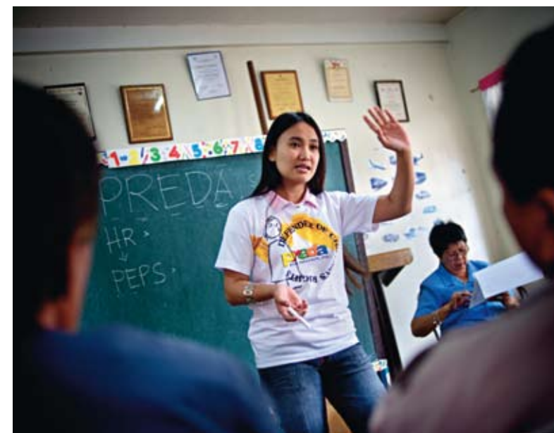
På Predas rehabiliteringscenter bor ett 100-tal pojkar och flickor. Här får de utbildning och trygghet.