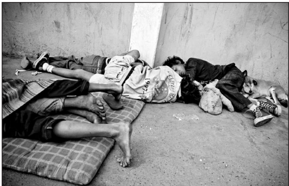
Nepals regering under ledning av maoisterna har stora uppgifter framför sig. En tredjedel av befolkningen lever i extrem fattigdom och hälften är analfabeter.