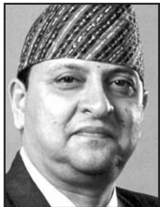
Gyanendra, Nepals siste kung

– Vi ska inte tillbaka till djungeln. Det tog tio år av folkkrig för att bli av med en 240-årig monarki, men nu måste alla småkungar bort för att vi ska kunna leda landet och bil-