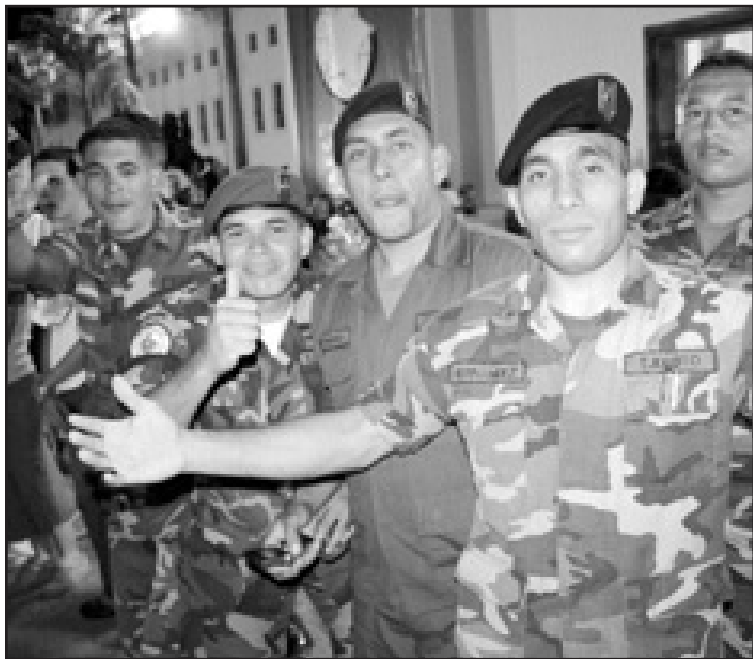
Nationalgardet välkomnar gästerna under Världsongdomsfestivalen. Militären, som till största delen består av män och kvinnor från underklassen, har från start varit delaktig i den bolivarianska revolutionen.

olika kvalitéer och kan utföra olika uppgifter.