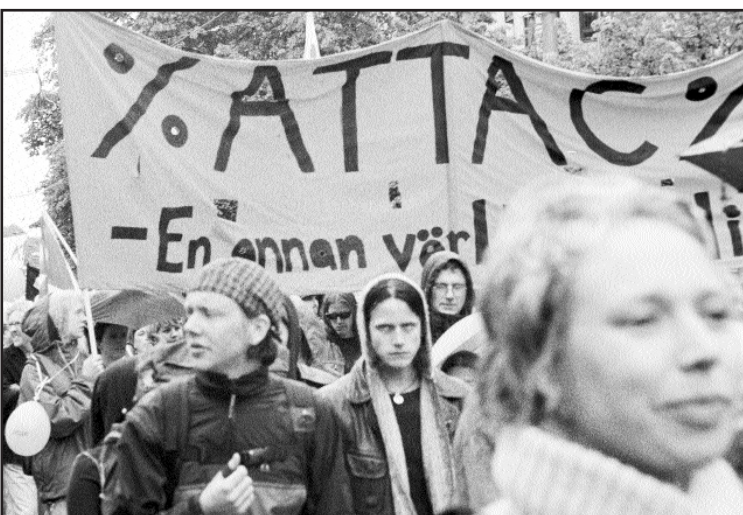
Attac har en framträdande roll i World Social Forum. Även i Sverige agerar Attac enligt principen att välja dialog framför konfrontation, vilket tydligt visats i arbetet för att rädda världen i Göteborg.

Skriften ger en rad exempel på hur det forum som säger sig stå för motstånd och mot utestängning, effektivt stänger ute FARC-gerillans representanter från Colombia eftersom de använder den väpnade kampen som taktik. Inte heller den kubanska delegationen gavs officiell status till WSF 2002. Venezuelas Hugo Chávez