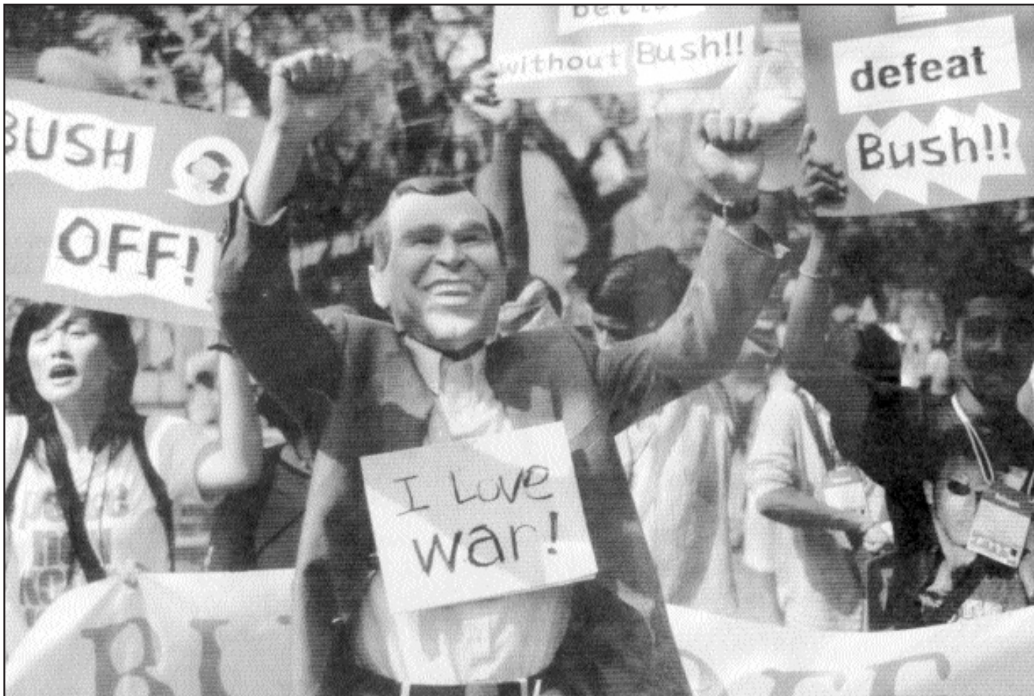
Broschyren lägger stor vikt vid att göra som Bush i jakten på kaparna – "follow the money". Man visar i flera kapitel hur de sociala forumen och deras huvudorganisationer får stora summor pengar av Ford, EU-kommissionen och Världsbanken. "Man behöver inte vara marxist för att förstå att det är kusken som bestämmer färderna", konstateras det i broschyren. Bilden från World Social Forum i Mumbai, Indien, i januari i år.

for till Paris. Frågan är om de ens hade satt sig i förhandlingar om de inte hade kunnat sätta kraft bakom orden och de facto slänga ut amerikanerna. Att tredje världens länder ska inleda förhandlingar med sina ekonomiska bödler blir som kommunalstrejkens rond två – totalt nederlag och fiasco. Matadoren mot den fastkedjade tjuren.