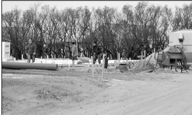
Polska byggnadsarbetare utnyttjas av Huskoncept AB i Malmö. Importen av lågavlönad arbetskraft riskerar att öka kraftigt om inte de övergångsregler svenska folket vill ha införs.

Risken finns att Sverige som enda land kommer stå utan övergångsregler 1 maj, med fara för dumpning av löner, arbets- och sociala rättigheter. Sent omsider har Göran Persson vaknat och regeringen har lagt ett urvattnat förslag till riksdagen. Dock utan den viktiga arbetsmarknadsprövningen, kontrollen om det finns behov av arbetskraft i aktuellt yrke. En eftergift för kapitalets krav på fri arbetskraftsimport.