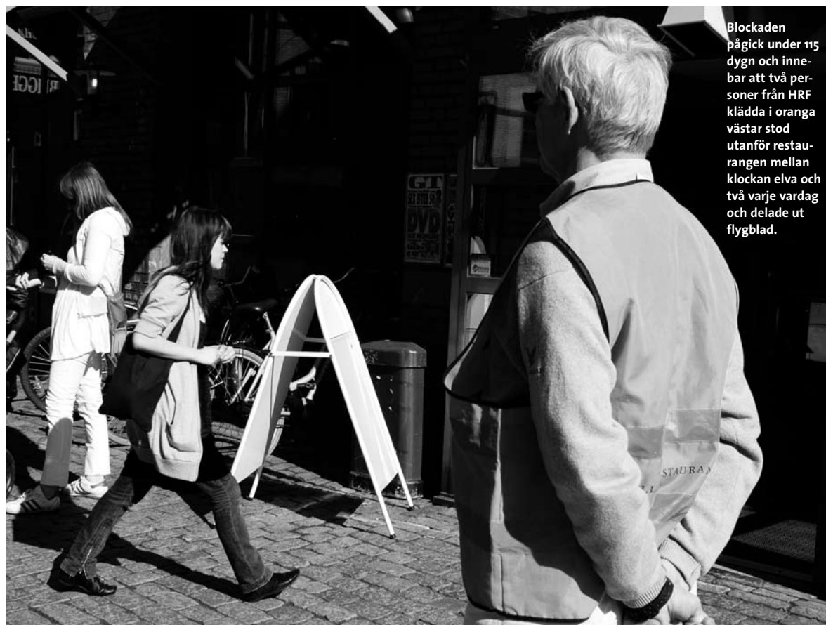
Blockaden pågick under 115 dygn och innebär att två personer från HRF klädda i orange västar stod utanför restaurangen mellan klockan elva och två varje vardag och delade ut flygblad.