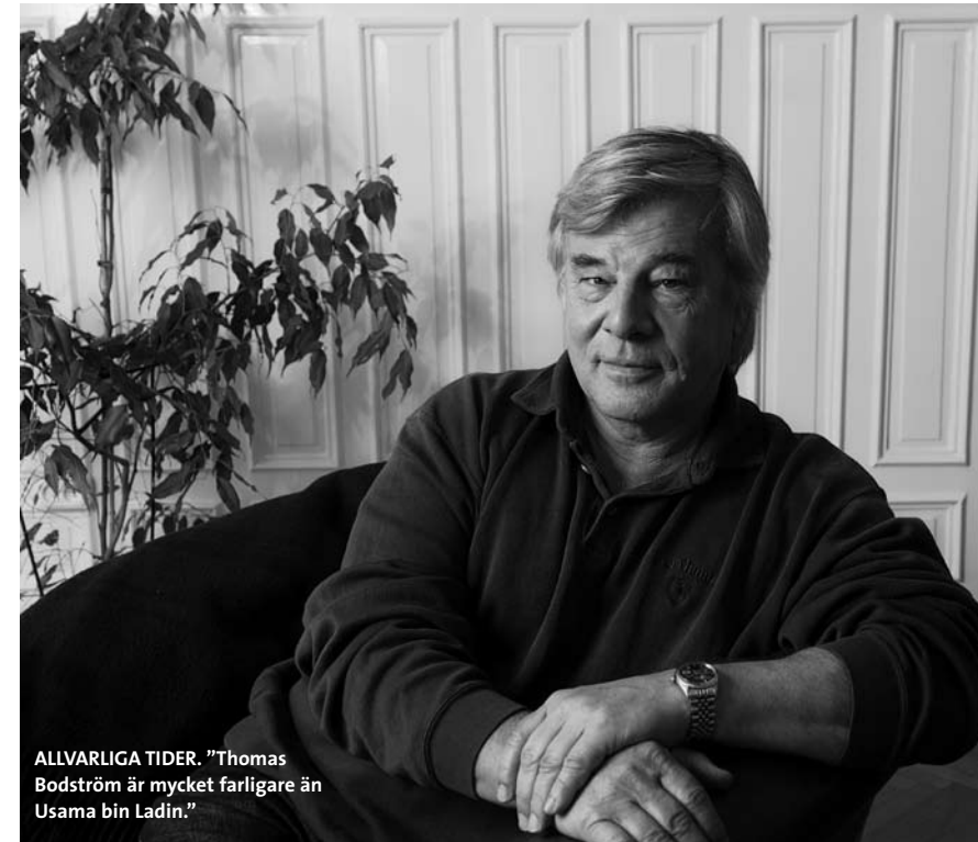
ALLVARLIGA TIDER. ”Thomas Bodström är mycket farligare än Usama bin Ladin.”

– Att skriva journalistik om en terrorrättegång är hopplöst eftersom man inte får reda på något av betydelse och man