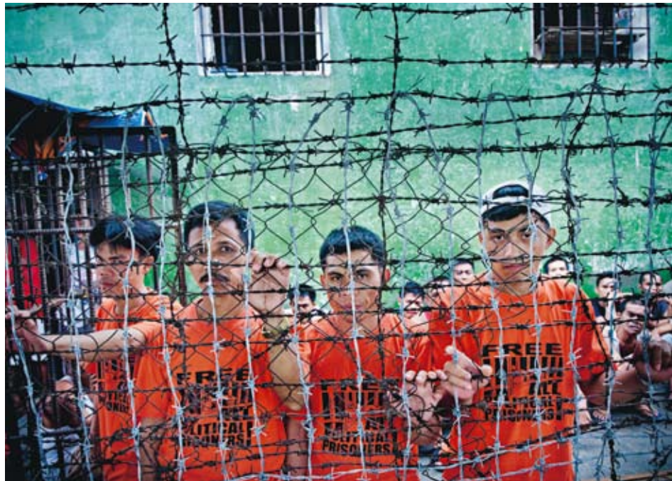
ANKLAGADE. Lunchrast i fängelset. Ett tjugotal politiska fångar står anklagade för att ha samarbetat med gerillan.