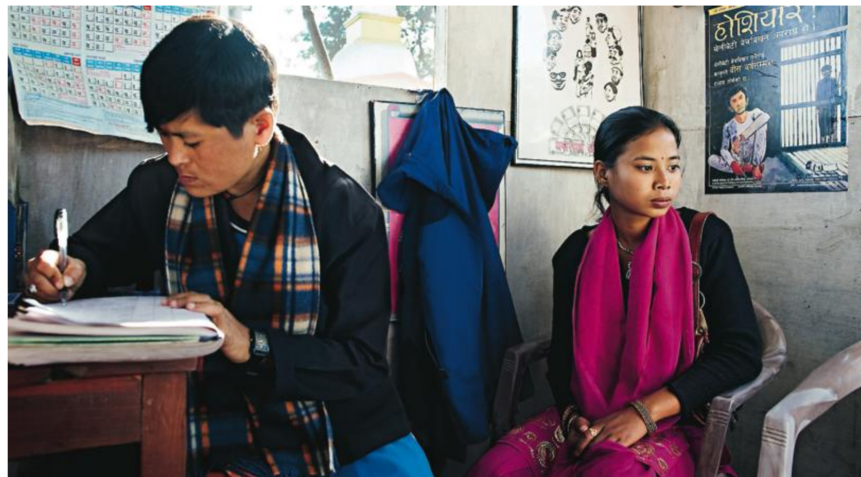
Av människohandlarna får flickorna falska identitetshandlingar och instruktioner om hur de ska bete sig för att lura Maiti Nepals gränsvakter. En ung kvinna får veta att jobbet hon var på väg till i Indien inte existerar.