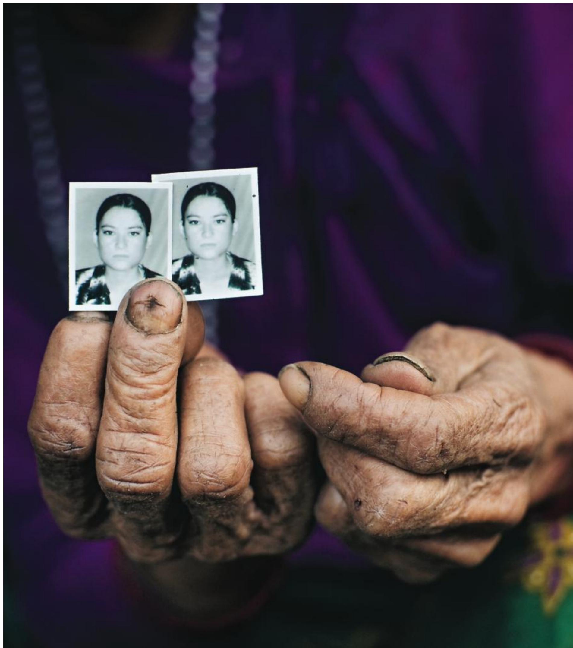
En mormor håller upp bilder på sin förlorade dotterdotter. Men som genom ett under är nu barnbarnet på väg tillbaka till sin hemby efter tio år. Innan hon skickas hem kommer hon att få yrkesutbildning hos hjälporganisationen Maiti Nepal.