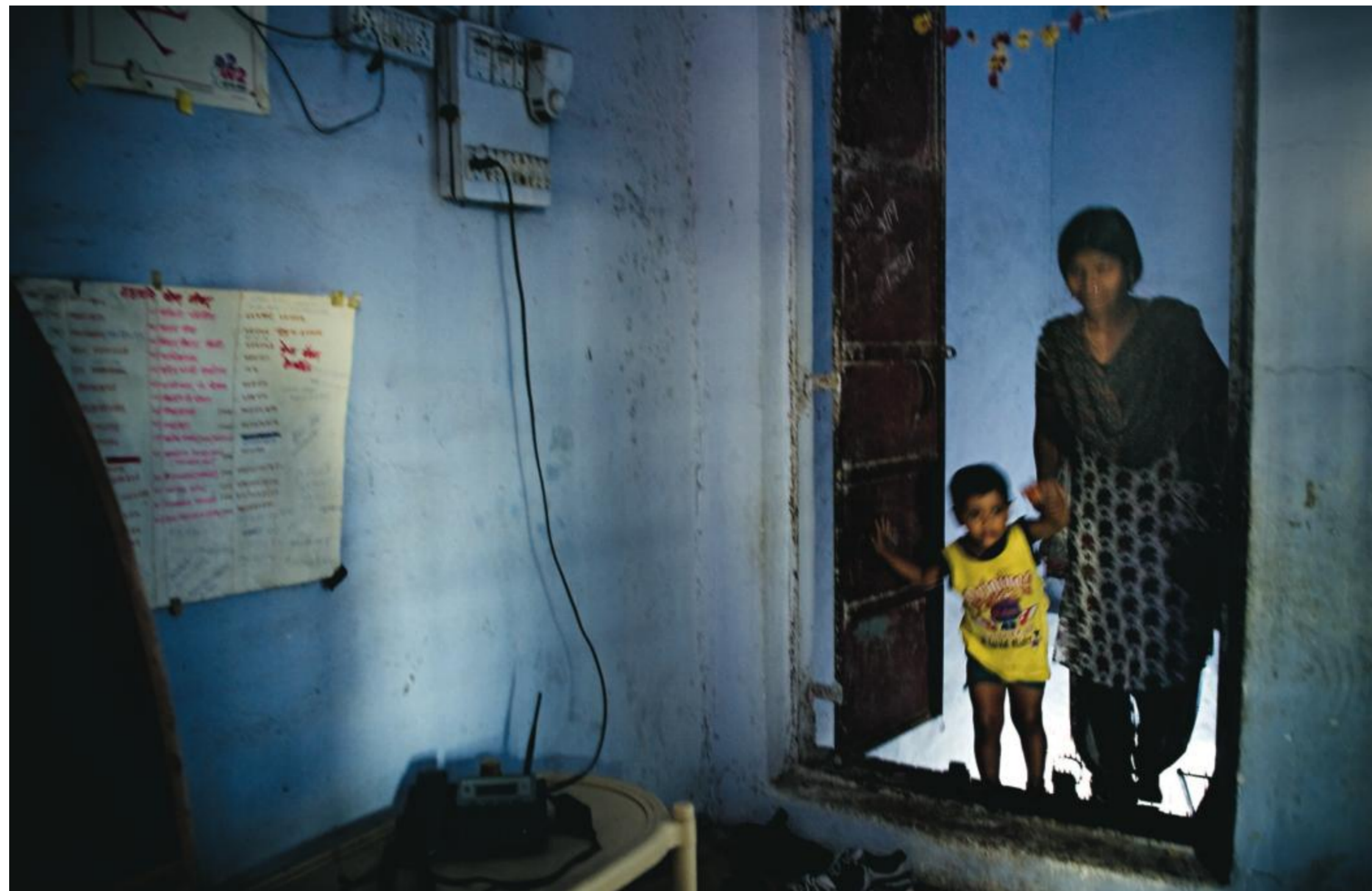
Bordellområdet är som en sluten värld. En prostituerad lämnar sin son på det nattöppna dagiset. Innan det öppnade fick barnen sova under sängen när mammorna arbetade.