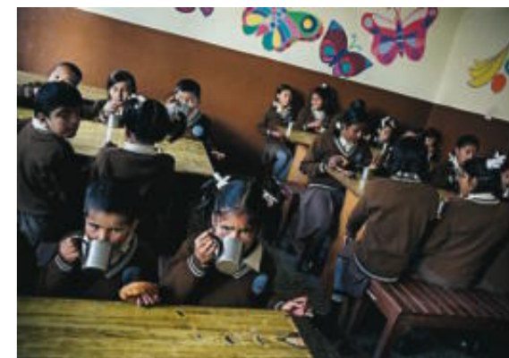
På Maiti Nepals rehabiliteringscenter i Katmandu bor cirka 200 kvinnor och barn. Alla är före detta sexslavar eller barn till sexslavar.