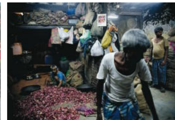
1,5 miljoner nepaleser jobbar utomlands och deras hemskickade pengar står för 20 procent av Nepals BNP. Här en gästarbetare i en lökfabrik i Indien.