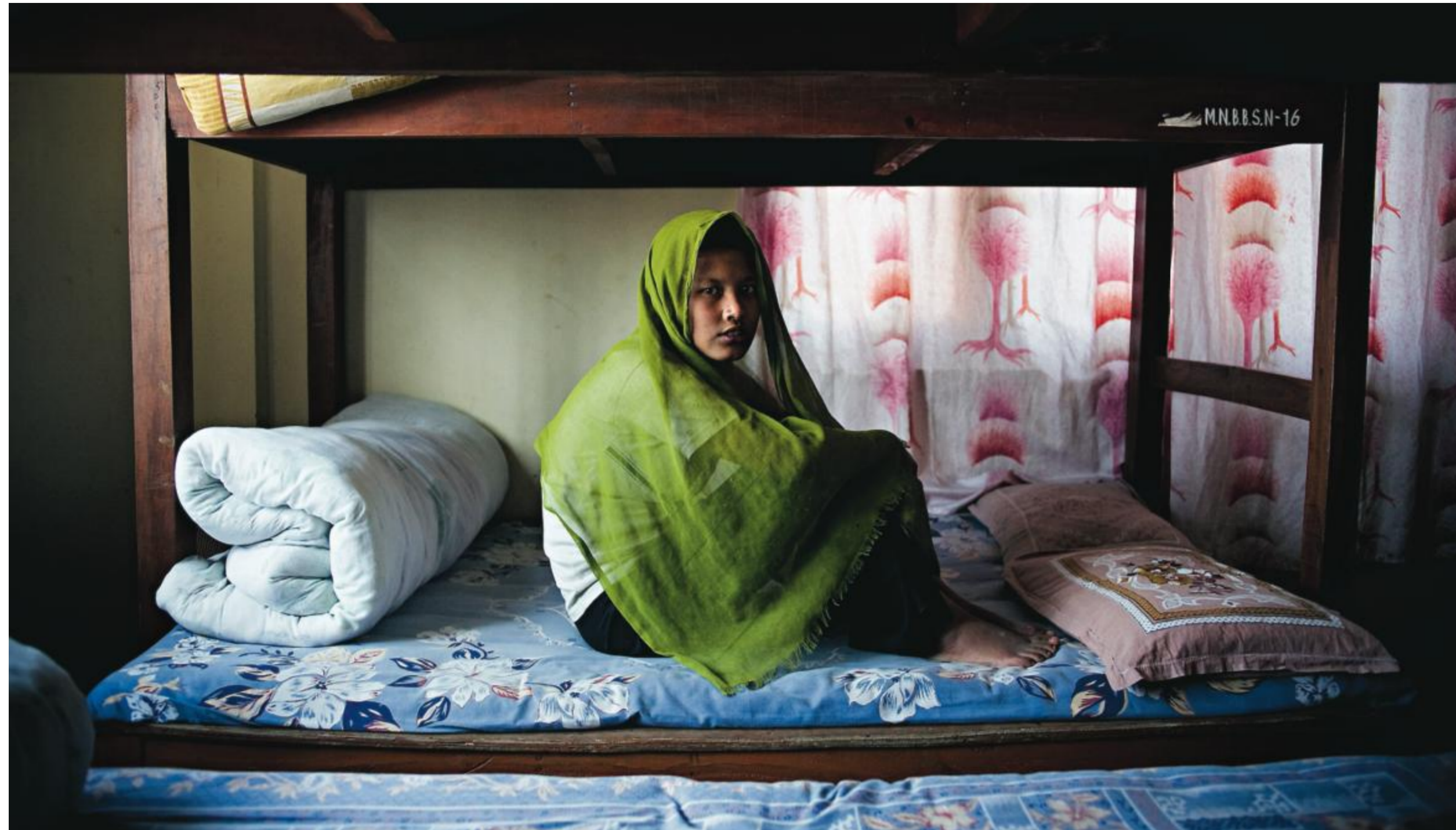
I en våningssäng på Maiti Nepals transitcenter sitter en 19-årig nepalesiska. Hon hade varit prostituerad i över tio år när hon räddades. Som många andra före detta prostituerade har hon hiv. Hon är psykiskt skadad och äter sitt eget hår.