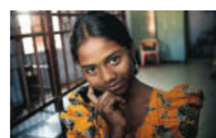
Utän pengar till utbildning är risken stor att de äldre tjejerna hamnar i prostitution.

stitution. Här får de medicinsk hjälp, psykologisk rådgivning och hjälp att hitta sina familjer. De som inte har någon yrkesutbildning kan få det. Flickorna får hjälp att söka arbete, låna pengar och starta företagsverksamhet under och efter rehabiliteringen.