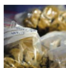
Drogsmuggling – en form av trafficking.

● trafficking Trafficking är en benämning på olika former av olaglig handel över nationsgränser, till exempel människohandel, slavhandel eller organiserad drogsmuggling. Källa: NE