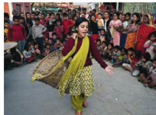
Eftersom många är analfabeter jobbar Maiti Nepal med sång, dans och teater för att informera om människohandeln.